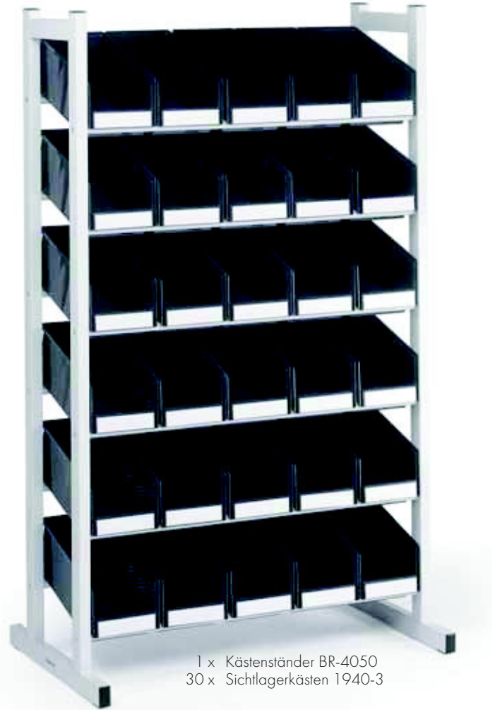
1 x Kästenständer BR-4050 30 x Sichtlagerkästen 1940-3