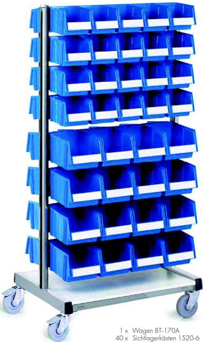
1 x Wagen BT-170A 40 x Sichtlagerkästen 1520-6 32 x Sichtlagerkästen 1930-6