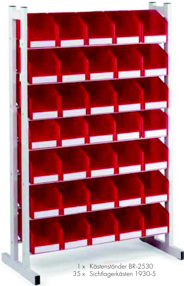
1 x Kästenständer BR-2530 35 x Sichtlagerkästen 1930-5