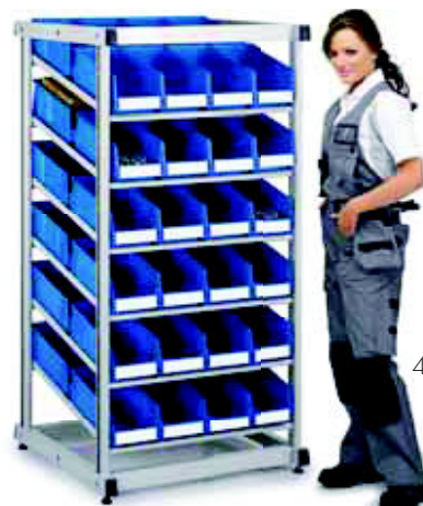
1 x Durchlaufregal DBS-808 48 x Sichtlagerkästen 1940-6

Das Durchlaufregal bietet viel Platz zum Sortieren großer Warenmengen im Verkaufs- und Lagerraum oder in der Fertigung. Die Ebenen sind in der Höhe verstellbar. Die Schubladen befinden sich auf den geeigneten Ebenen. Bei Entnahme leerer Sichtlagerkästen rutschen die vollen Kästen durch die Schwerkraft leicht nach vorne. Passend für 48 TRESTON-Sichtlagerkästen Typ 1940 (bitte separat bestellen). Gestell aus grauem pulverbeschichtetem Stahlrohr und 6 schrägen Ebenen. Mit Ausgleichfüßen. Max. Last ca.70 kg/Ebene und 420 kg/Ständer. Ebene T x B x H: 700 x 755 mm. Außenmaße T x B x H: 825 x 830 x 1650 mm Lenkrollen-Set auf Anfrage.