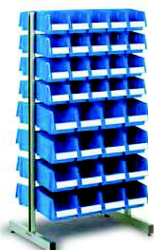
1 x Zweiseitiger Ständer BS-160TA 40 x Sichtlagerkästen 1520-6 32 x Sichtlagerkästen 1930-6