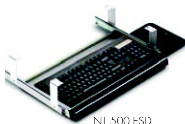
NT 500 ESD