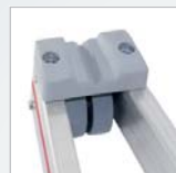
Anlegegummi und Rolle am Oberteil