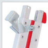
Sicherungshebel und Anlegeklotz

Achtung: Glasreinigerleitern dürfen gemäß BGI 694 aufgrund ihrer aus Gewichtsgründen knappen Dimensionierung nur mit max. 80 kg (0,8 kN) belastet werden. Alle Hymer-Glasreinigerleitern erfüllen diese Anforderung. Sie können bei voller Länge durchweg mit 100 kg (1,0 kN) und bei kürzeren Längen bis 150 kg (1,5 kN) wie übliche Leitern belastet werden. Belastbarkeit 5-teiliger Satz: max. 100 kg (1,0 kN).