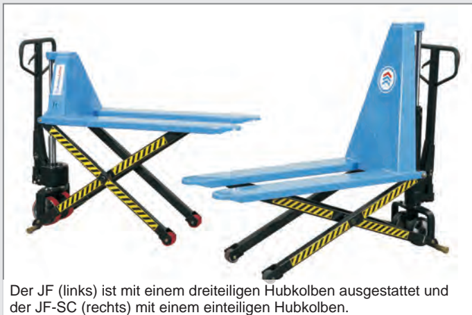
Der JF (links) ist mit einem dreiteiligen Hubkolben ausgestattet und der JF-SC (rechts) mit einem einteiligen Hubkolben.