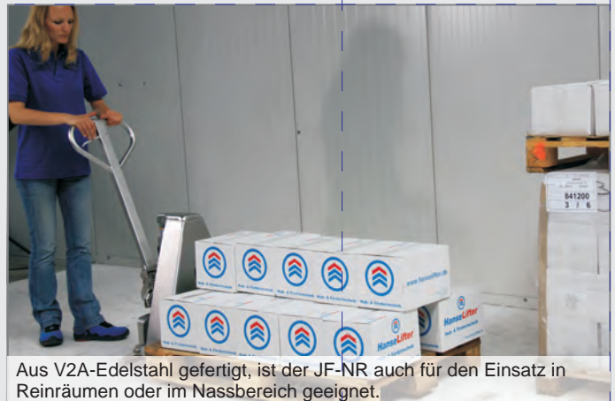
Aus V2A-Edelstahl gefertigt, ist der JF-NR auch für den Einsatz in Reinräumen oder im Nassbereich geeignet.