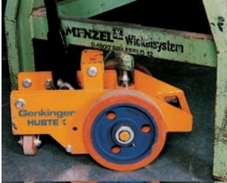
Niedrige Bauweise und damit optimaler Einschlagwinkel. Low overall height and thus optimum degree of lock.