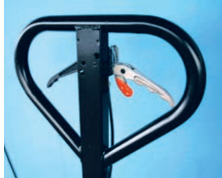
Option: Feststellbremse Option: parking break